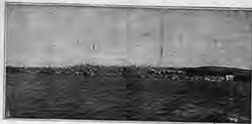
ΑΠΟ ΠΙΣ ΜΟΣΧΟΝΗΣΙΩΝ (Ἐπιγραφὴ Κυθωνίων. Εἰκὼν ληφθεῖσα ἐξ ἀποστάσεως)