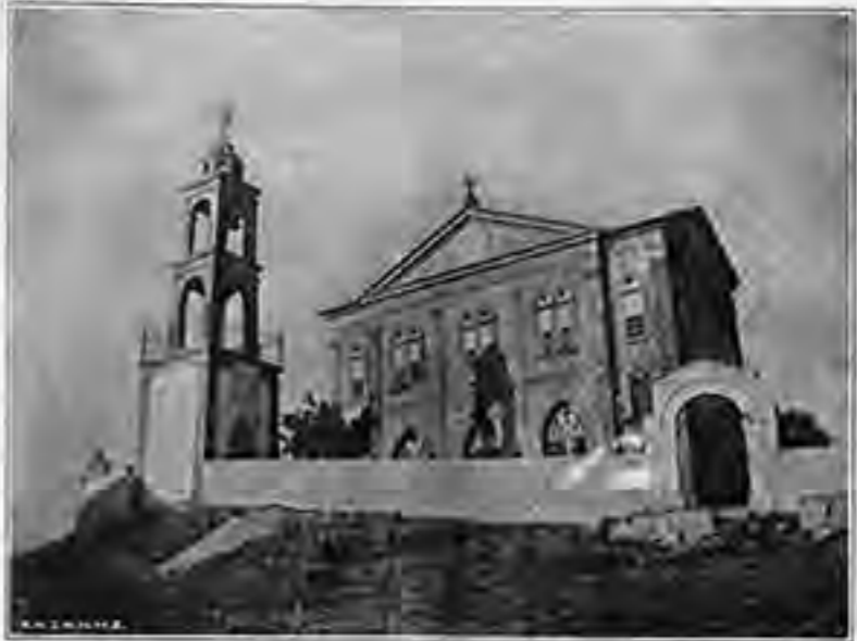
ΝΑΟΣ ΠΡΟΦΗΤΟΥ ΗΛΙΟΥ ΕΝ ΚΥΔΩΝΙΑΙΣ